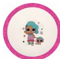
REF. 01-6024 Tigela Ecológica LOL Surprise