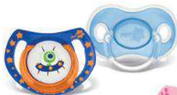
4010 - tam. 2 - orto. (B) 4011 4012