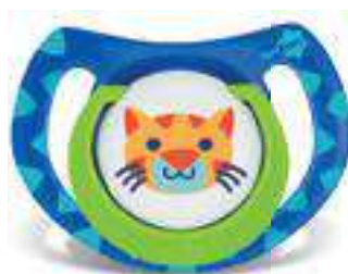
4856 - tamanho 1 (B) 4866 - tamanho 2