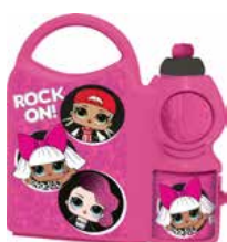
REF. 01-6022 Lancheira c/ Squeeze LOL 400ml