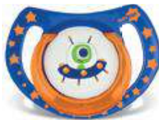
4851 - tamanho 1 (B) 4861 - tamanho 2