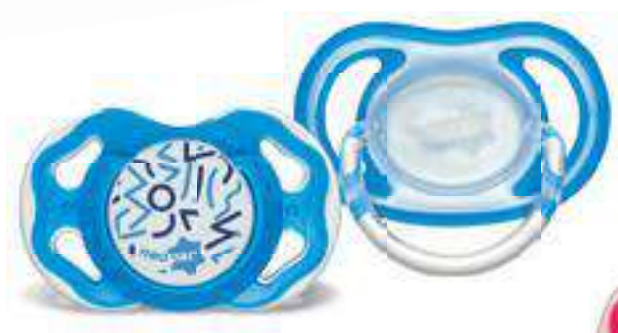
4020- tam. 2 - orto (B) 4021 4022