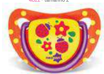
4812 - tamanho 1 (B) 4822 - tamanho 2