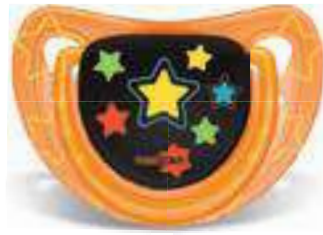
4815 - tamanho 1 (B) 4825 - tamanho 2