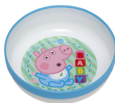
REF. 01-6055 Tigela Peppa Pig Azul