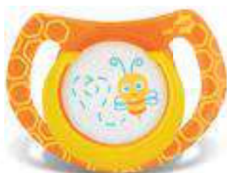
4855 - tamanho 1 (B) 4865 - tamanho 2