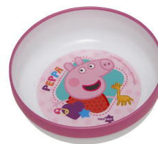
REF. 01-6056 Tigela Peppa Pig Rosa