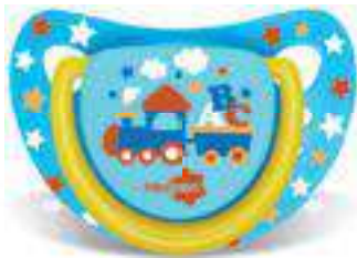
4819 - tamanho 1 (B) 4829 - tamanho 2