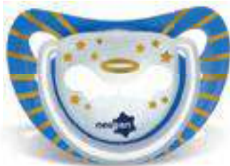
4870 - tamanho 1 (B) 4880 - tamanho 2