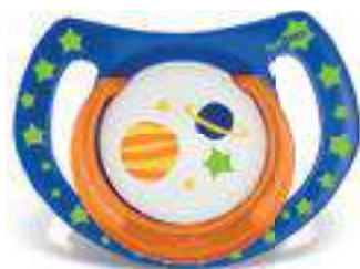
4850 - tamanho 1 (B) 4860 - tamanho 2