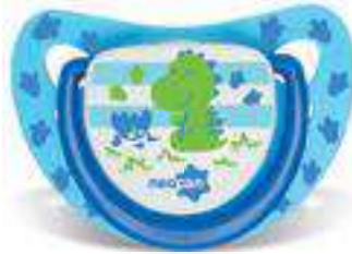
4871 - tamanho 1 (B) 4881 - tamanho 2