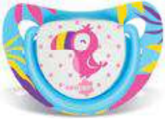
4878 - tamanho 1 (B) 4888 - tamanho 2