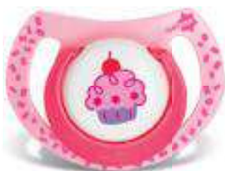
4852 - tamanho 1 (B) 4862 - tamanho 2