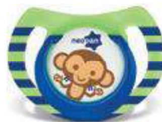
4854 - tamanho 1 (B) 4864 - tamanho 2