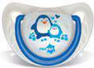
4874 - tamanho 1 (B) 4884 - tamanho 2