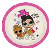
REF. 01-6026 Prato Ecológico LOL