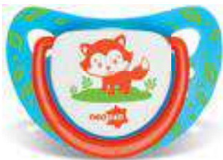
4816 - tamanho 1 (B) 4826 - tamanho 2