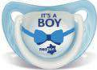
4876 - tamanho 1 (B) 4886 - tamanho 2