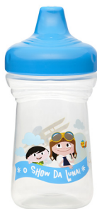
REF. 01-6036 Copo Anat. O Show da Luna 300ml