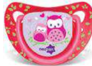
4818 - tamanho 1 (B) 4828 - tamanho 2