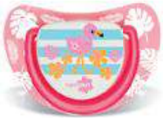
4872 - tamanho 1 (B) 4882 - tamanho 2