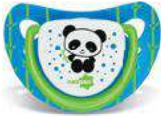
4814 - tamanho 1 (B) 4824 - tamanho 2