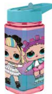
REF. 01-6021 Garrafa Quadrada LOL 510ml