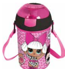
REF. 01-6019 Cantil Abre Fácil LOL 450ml