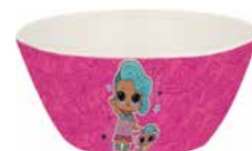
REF. 01-6025 Tigela Cônica Ecológica LOL