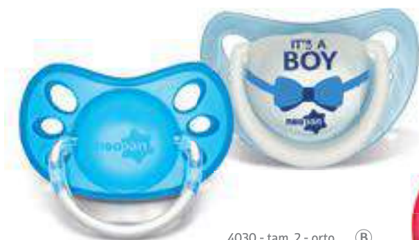
4030 - tam. 2 - orto. (B) 4031 4032