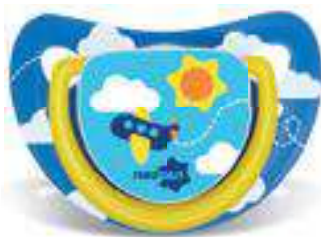
4811 - tamanho 1 (B) 4821 - tamanho 2