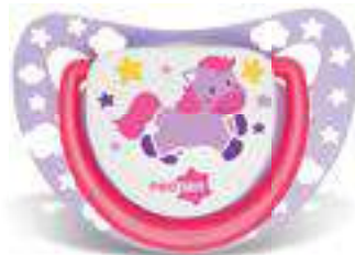
4817 - tamanho 1 (B) 4827 - tamanho 2