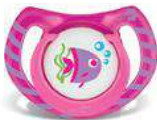
4853 - tamanho 1 (B) 4863 - tamanho 2