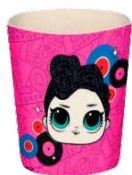
REF. 01-6027 Copo Ecológico LOL 270ml